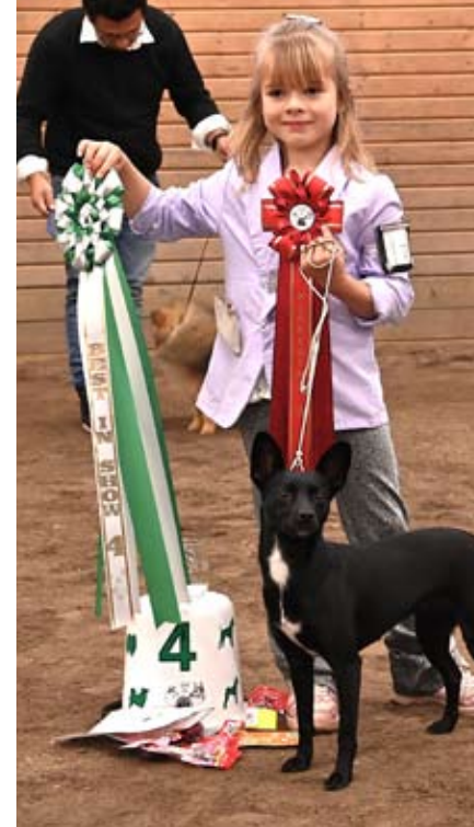
Bilder från SSUK:s utställningar i Höganäs och Timrå.

Sist detta jubileumsår blev Timrå, dit vi återkommit många gånger. Där bjöd vi på dricka och pepparkakor. Vinnarna i BIS finalerna fick var sitt minnesglas här och i Gränna.