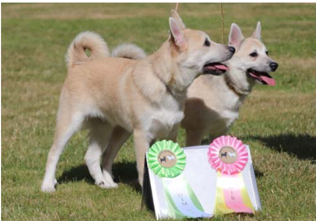
BIR och BIM Valp