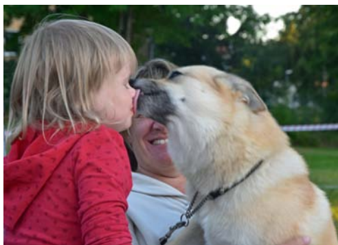
"Haha, jag hann först!"