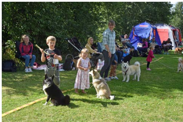
Barn med hund ...eller kanske i vissa fall hund med barn...