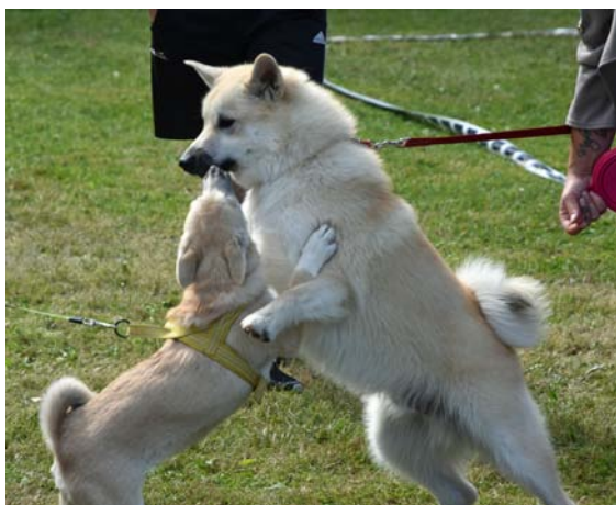
"Okej, jag är mindre än du, men du skulle bara veta hur farlig jag är"