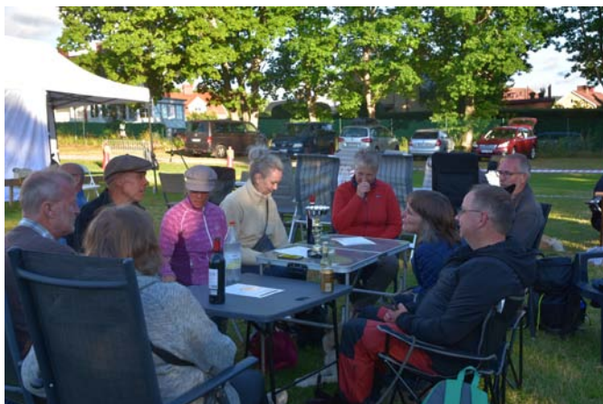
Tomtelundare vid middags- bordet.