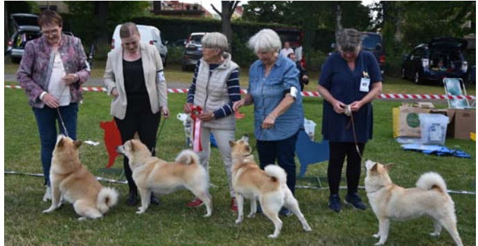
Vinnare Uppfödarklass (Kennel Honningsrosa)