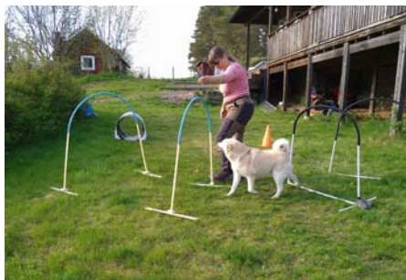
Träning inför Buhunds specialen?

Håll utkik på hemsida och Facebook för uppdateringar!