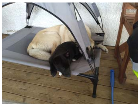
Laddningsstation för Buhundar

Vi tror på en rasspecial! Det sägs att hoppet är det sista som överger människan och vi tror verkligen att det äntligen kommer gå att träffas i Vadstena den 7–8 augusti. Upplägget blir lite annorlunda i år med anpassningar till den rådande pandemin. Vi kommer i stället för buhunds spelen att göra andra aktiviteter där möjlighet finns att hålla gott avstånd. Späckat program kan vi i alla fall utlova i den historiska staden Vadstena. Ringträning, utställning, Lobells kommer och ger konkreta tips och övningar för ett bra liv med din buhund, tipspromenad och prova på aktiviteter, och så det klassiska 60-metersracet förstås! Vi ska också försöka ordna en gemensam säker middag på lördagens kväll där vi hoppas att ni alla vill delta, om än på lite avstånd.