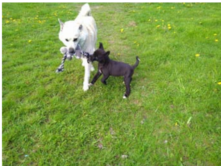
Mästaren och adepten

Det bästa vi kan göra är att tillsammans kämpa för att fler får chansen att uppleva buhundens charm och tillgivenhet. Det gör vi varje dag som ambassadörer för vår ras.