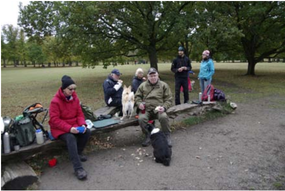
Även hussar och mattar behöver något att äta och då skall man passa på och hålla sig framme...