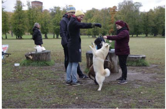
Vad gör man inte för en godisbit...