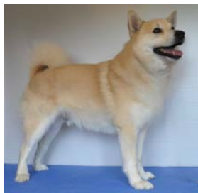
Hane: Gnipagrottans QU regnr: SE15470/2011