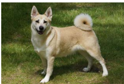
Tik: Gnipagrottans Otilia regnr: 15481/2011

Beräknad födelse ca början av september.