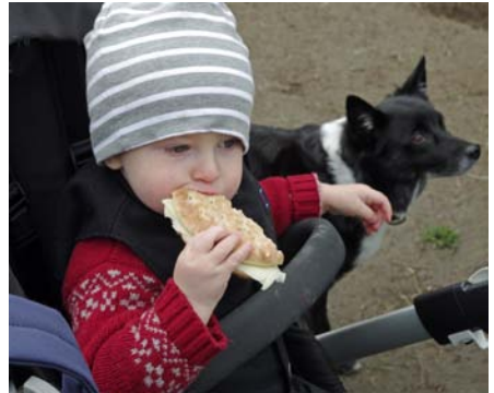
Gott med en macka! Det tyckte också den främmande hund som sekunderna efter i ett obehövligt ögonblick tog mackan ur pojkens hand och försvann.