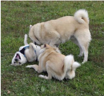
Hihhi, kittlas inte...