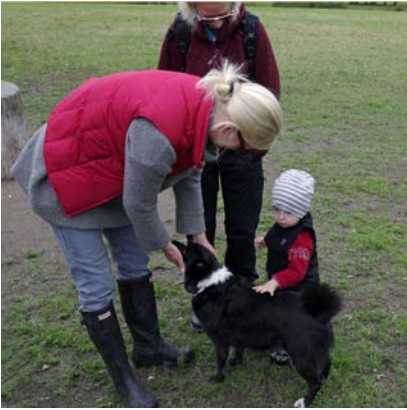
Lycka är att klappa en Buhund